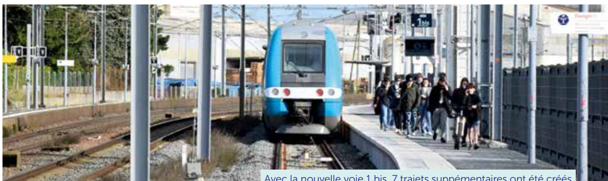
Avec la nouvelle voie 1 bis, 7 trajets supplémentaires ont été créés

Dans la stratégie de développement des déplacements doux, priorité de l'équipe municipale de Rémy Orhon, le train occupe une place essentielle. La récente mise en service d'un nouveau terminus technique offre de nouvelles perspectives.