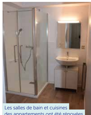
Les salles de bain et cuisines des appartements ont été rénovées

leur convenance, ce qui permet une transition douce entre leur précédent domicile et la résidence.