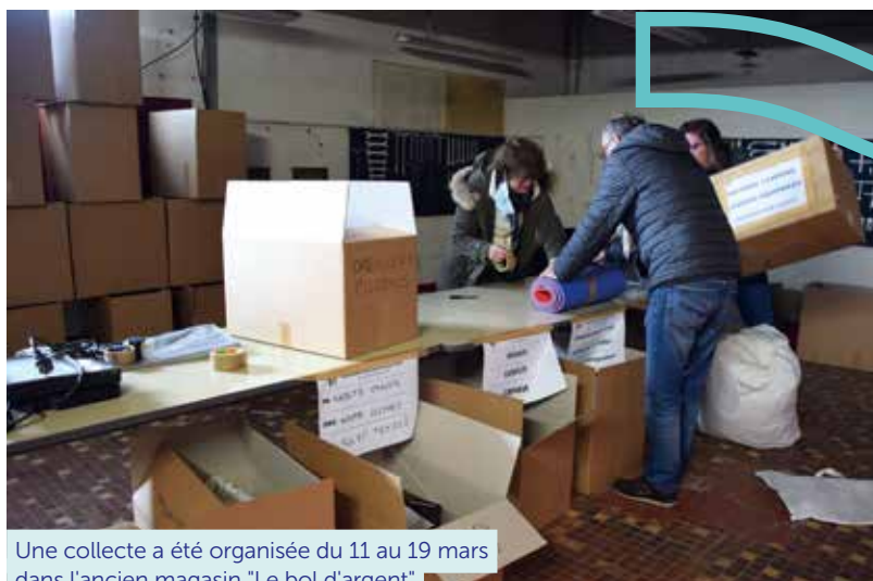
Une collecte a été organisée du 11 au 19 mars dans l'ancien magasin "Le bol d'argent"

Les personnes souhaitant héberger des réfugiés ukrainiens peuvent se faire connaître en mairie ou à la préfecture qui est en charge de la gestion de l'accueil des réfugiés.