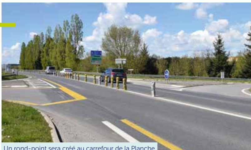
Un rond-point sera créé au carrefour de la Planche

Compte tenu des besoins des entreprises et des habitants des villages, le maire, Rémy Orhon, s'est engagé fortement pour la réalisation de deux nouveaux ronds-points à la sortie de l'Espace 23, sur la route de Nort-sur-Erdre et au carrefour de la Planche. Pour ce dernier, le conseil départemental a donné un feu vert de principe. La COMPA, qui dispose de la compétence développement économique, assurera le financement et la réalisation. Il s'agit d'une bonne nouvelle pour les entreprises concernées mais aussi pour la sécurité de ceux qui empruntent ces routes. Les habitants des villages d'Ancenis-Saint-Géréon pourront aussi bénéficier de ces ronds-points.