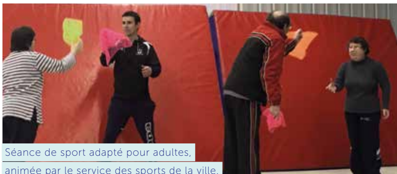
Séance de sport adapté pour adultes, animée par le service des sports de la ville.

Les 3 premières séances d'octobre sont gratuites. Ensuite, le tarif va de la gratuité à 70 € pour l'année en fonction des ressources.