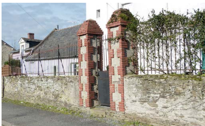
Clôture traditionnelle avec muret de soubassement, grille métallique végétalisée et piliers ouvragés en brique appareillée. Ancenis, rue de la Mariolle.

Cette notion est encore renforcée lorsque la clôture constitue un prolongement de la construction principale, lorsque son dessin et les éléments qui la composent «rappellent» les caractéristiques architecturales des constructions présentes sur la parcelle et dans la rue ou le quartier.