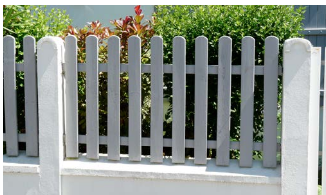
Muret bas, barreaudage bois et haie taillée (1930 à nos jours). Saint-Nazaire