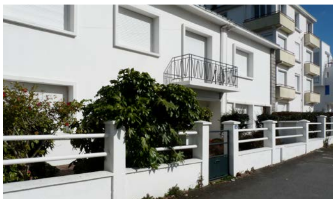
Muret bas, lisses métalliques et haie en port libre (1950/1960). Teintes en harmonie avec la façade. Saint-Nazaire