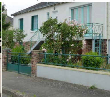
Muret en attente de rénovation avec couronnement à prévoir. Ancenis.