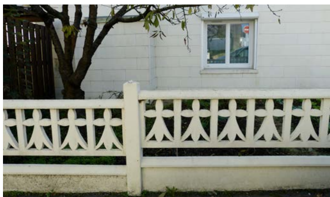
Muret bas à redents et clai à motifs en ciment armé (des années 1930 à nos jours). Saint-Nazaire