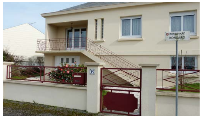
Clôture restaurée avec murets, piliers et ferronneries peints en accord avec la maison.

Différents modèles préfabriqués existent dans le commerce. Le choix devra être adapté à l'esprit de la clôture existante.