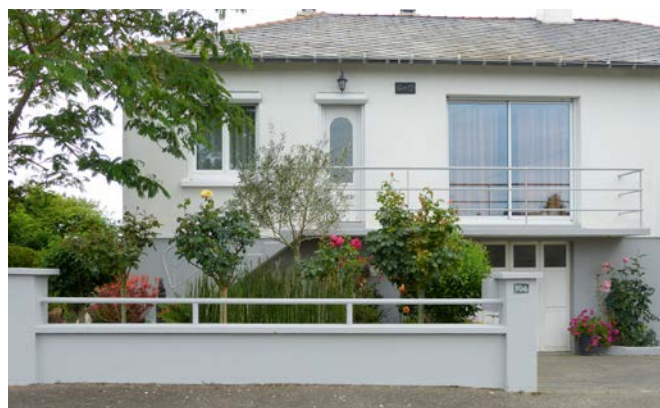
Clôture représentative des années 1950-1960, muret peint avec couronnement et lisse métallique. Saint-Géréon, Av de la Rougeaudière.

La clôture peut évoluer si elle reste dans l'esprit initial, (architectural et paysager), du quartier où elle se trouve.