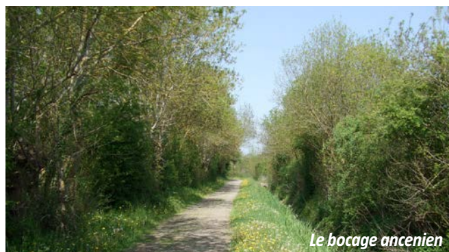
Le bocage ancien