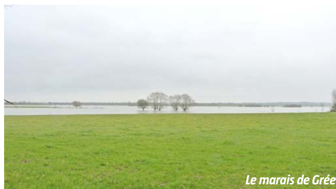
Le marais de Grée