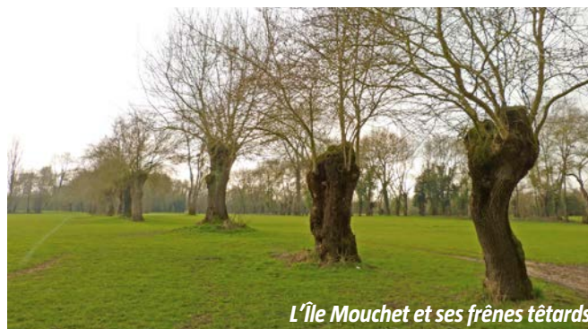
L'île Mouchet et ses frênes têtards